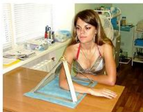
Лечение болезней локтевого сустава