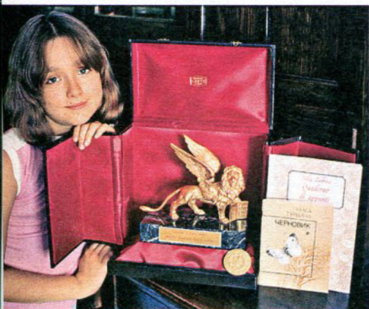
Юная поэтесса Ника Турбина с присужденным ей в 1985 году призом «Золотой лев Венеции»

Психологи отмечают, что эти подростки очень чувствительны и ранимы. Им тя-